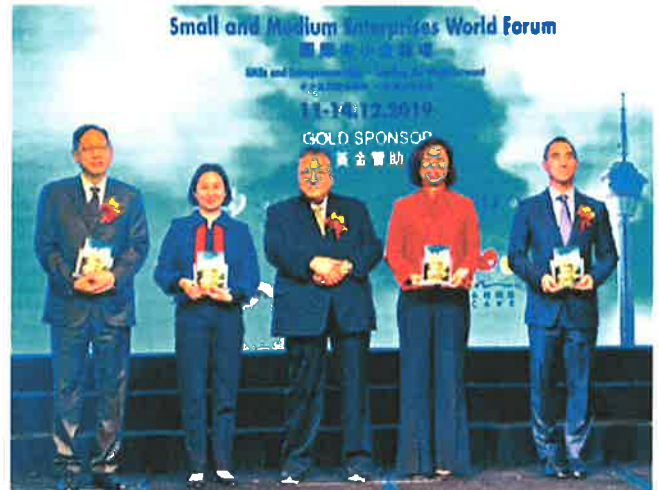
■ 澳門日前第一次舉辦國際中小企論壇2019，請咗全球400幾個政商及學者出席。

其實澳門賭牌2022年就到期，當地政府續牌條件上都加入可持續發展要求，相信中小企嘅呢方面力量都不容忽視。