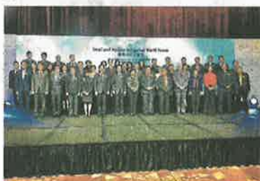
圖為國際中小企論壇嘉賓大合照。